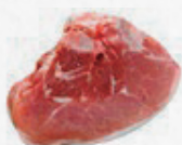
Puntas de Lomo con Hueso